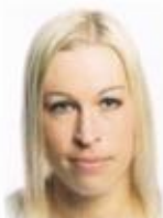
Ein typischer Fall von dünnem Haar

■ Die Ursachen: häufiges, oft auch falsches Waschen, Kämmen und Bürsten der Haare – besonders im nassen Zustand. Gerade dann ist das Haar nämlich besonders empfindlich. Aber auch Hitzestyling mit Glätteisen und Fön sowie häufige chemische Colorationen belasten das Haar enorm. Hinzu kommen externe Einflüsse wie Sonne, Salz- und Chlorwasser sowie eine alterungsbedingt abnehmende Haarstärke.