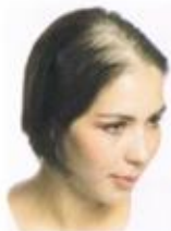
Haarausfall und dünnes Haar gibt es in allen Altersgruppen

■ Die Ursachen: Hauptursache von Haarverlust ist die genetische Veranlagung und der damit verbundene altersbedingte Haarausfall.