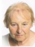
Bei Haarausfall wird die Kopfhaut zunehmend sichtbar

Dazu kommen aber auch externe Faktoren wie Stress, Schadstoffe, Krankheiten und Nährstoffmängel aufgrund falscher Ernährung sowie chemische Behandlungen mit Blondierungen etc.